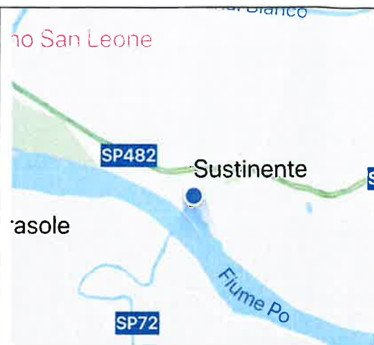
Fiume Po - Comune di Sustinente Tratto di scarpata in c.a.- s.g. 246