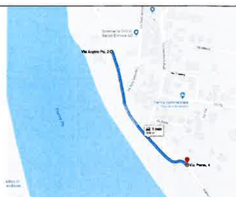
Fiume Po - Comune di Ostiglia Centrale termoelettrica su scarpata arginale