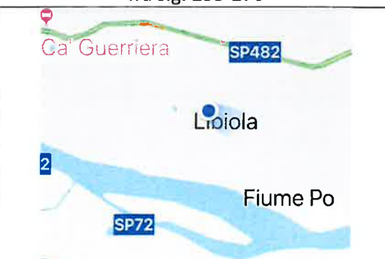
Fiume Po - Comune di Serravalle a Po Scarpata arginale in golena chiusa fra s.g. 270-287