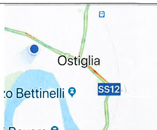
Ostiglia Comune di Ostiglia Scarpata in c.a. Fra s.g. 307 a 313