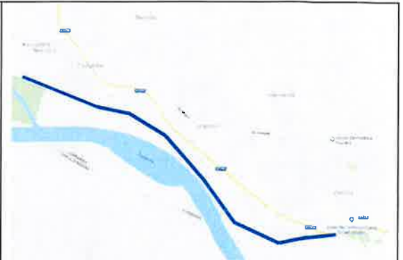
Da s.g. 1 a 25 – Sommità arginale in concessione al Comune di Viadana ad uso pista ciclabile