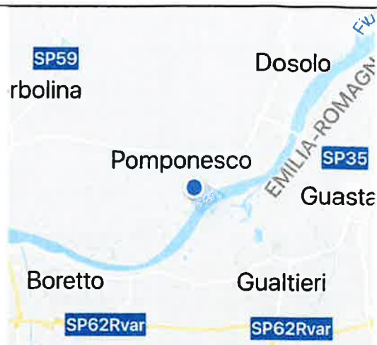
Fiume Po - Comune di Pomponesco S.g. da 49 a 61