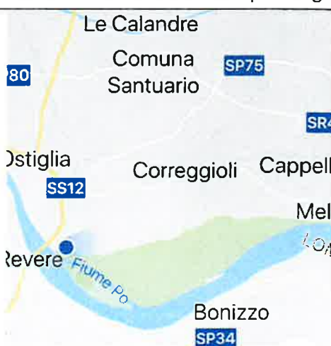
Fiume Po - Comune di Ostiglia

LA PROGETTISTA (F.E.T. ARCH. LORELLA TOGLIANI)