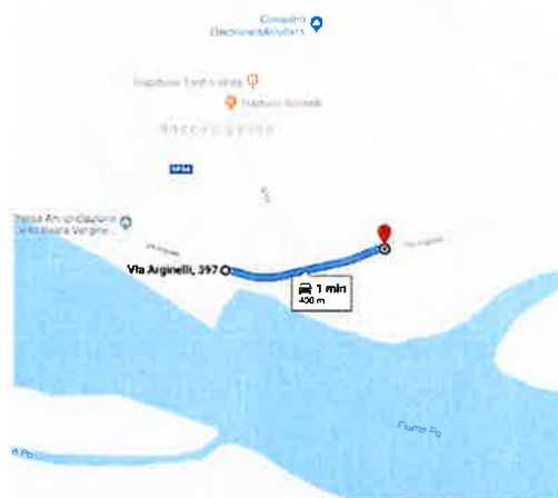
Comune di Borgo Virgilio da s.g. 167-169 Scarpata e muro in c.a. (400 m)