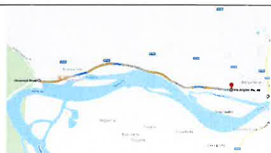
Fiume Po - Comune di Borgo Virgilio Località Borgoforte Pista di servizio con divieto di transito veicolare, da s.g. 127 a 158 Concessione alla Provincia di Mantova: ciclovía Eurovelo 8